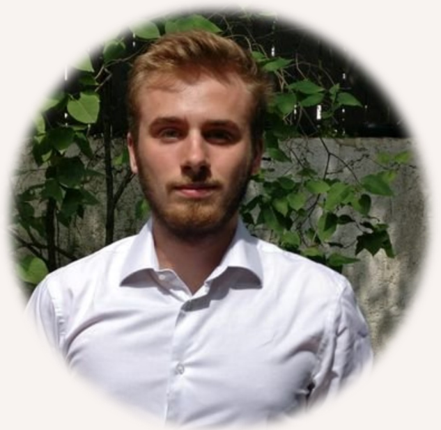
Antoine Dugast, Président de la FNEK

En effet, les frais de scolarité des IFMK sont pour la majorité des étudiants la plus grosse dépense à supporter, ce qui influe de manière conséquente sur la précarité étudiante.